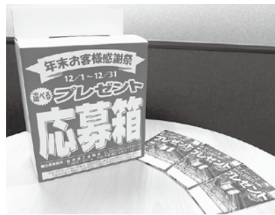
参加店の店頭で設置される、応募ががき付リーフレットと応募箱。

感謝祭には、応募ががき付リーフレットをご購入いただき、店頭に設置していただくだけで参加できます。また、一定数以上のはがきをまとめてご購入いただいた場合には、リーフレットに広告を掲載することも可能なので、お客さまへのサービスに加え、お店のPRにもご利用いただけます。 毎年、実行委員会に届く応募ががきは30万通を超え、大変多くの方に好評をいただいています。商店街やお店によっては、独自に年末の売り出し企画を行っているところも多いですが、年の瀬の仙台的のまちをみんなで盛り上げていくため、ぜひ「年末お客様感謝祭」にご参加ください。