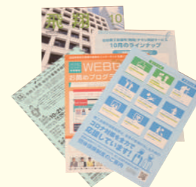
挟み込みチラシイメージ